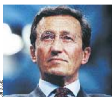
Il presidente del Dipartimento economico di Palazzo Chigi. Ma il Tesoro teme sovrapposizioni: dalle tasse all'Alitalia, passando per i piani sul Sud e il welfare.

ROMA ■ Conto alla rovescia per Gianfranco Fini (nella foto): la prossima settimana il vicepremier dovrebbe vedersi assegnati i nuovi incarichi della presidenza del Cipe e della guida del Dipartimento economico di Palazzo Chigi. Ma il Tesoro teme sovrapposizioni: dalle tasse all'Alitalia, passando per i piani sul Sud e il welfare.