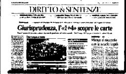
A giurisprudenza è l'ora dell'1+4. La commissione Siligani conclude oggi i lavori preparatori del decreto con cui il Mur introduce (al posto del 3+2) la nuova laurea a ciclo unico per le professioni legali.

BORSE Previsto un trend laterale fino ad agosto