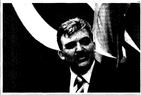
Gul eletto presidente della Turchia, il gelo dell'esercito Abdullah Gul (nella foto) è l'11° presidente della Repubblica turca. Ministro degli Esteri uscente, è stato eletto con i voti dell'Akp, il partito conservatore. Gul è il primo capo islamico dello Stato in 84 anni di storia della Turchia. I militari, da sempre difensori della laicità, non hanno presentato al giuramento. Servizi • pagina 6

Gionata in forte ribasso per Wall Street con il Dow Jones in calo del 2,1% e il Nasdaq del 2,7%. Le scivole dei titoli Usa ha condizionato anche la chiusura delle piazze europee, con perdite superiori all'uno per cento (a Milano l'S&P ha ceduto l'1,0%). Debole ieri anche il prezzo del petrolio. La serie di sedute positive dei mercati azionari si è inceppata a causa dei dati macroeconomici, in particolare per l'indice di fiducia dei consumatori americani (scesa a 105 punti in agosto da 110,9 di luglio) e per il prezzo del