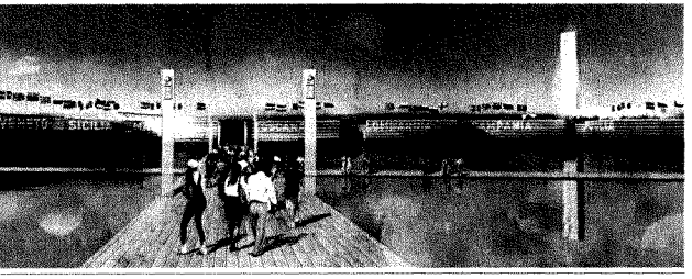
Così la diplomazia ha convinto il Sudamerica di Marco Alfieri

Applausi e abbracci: così la delegazione italiana ha accolto ieri a Parigi, nella sede delle Bie (il Bureau International des Expositions), la notizia della vittoria di Milano per l'Expo del 2015. L'Italia ha battuto la Turchia e la sua candidata Smirne per 86 voti a 65. Per il presidente della Repubblica, Giorgio Napolitano, la vittoria di Milano e dell'Italia è motivo di orgoglio ed è la prova «di come si possa fare sistema se si superano contrapposizioni pregiudiziali e fuorvianti». L'Expo di Milano metterà in moto investimenti complessivi per 20 miliardi di euro, di cui 10 dedicati alle infrastrutture (allestimento di site e opere per la mobilità), e porterà alla creazione di 70 mila posti di lavoro.