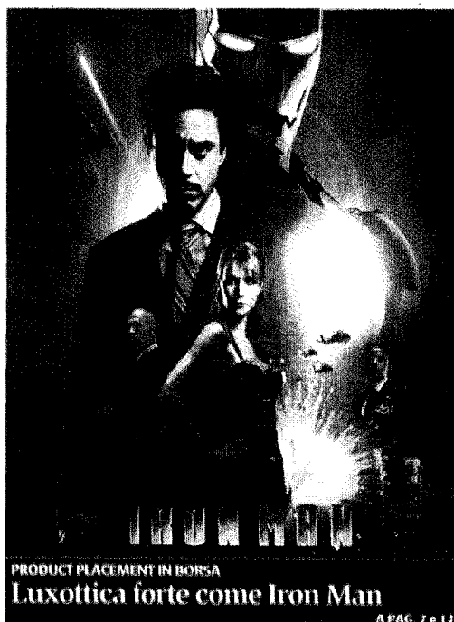
PRODUCT PLACEMENT IN BORSA Luxottica forte come Iron Man

Il Governatore della banca centrale svizzera richiama con severità le banche per i super stipendi e premi. Perché da noi, nonostante le cifre da capogiro e le denunce dei giornali, non succede niente del genere?