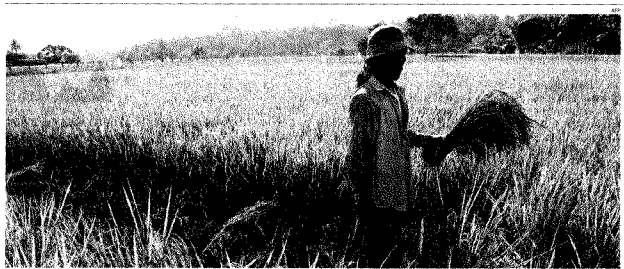
Filippine. Raccolta di riso nell'isola di Mindanao: per prevenire rivolte Manila ha dovuto disporre vendite di scorte statali