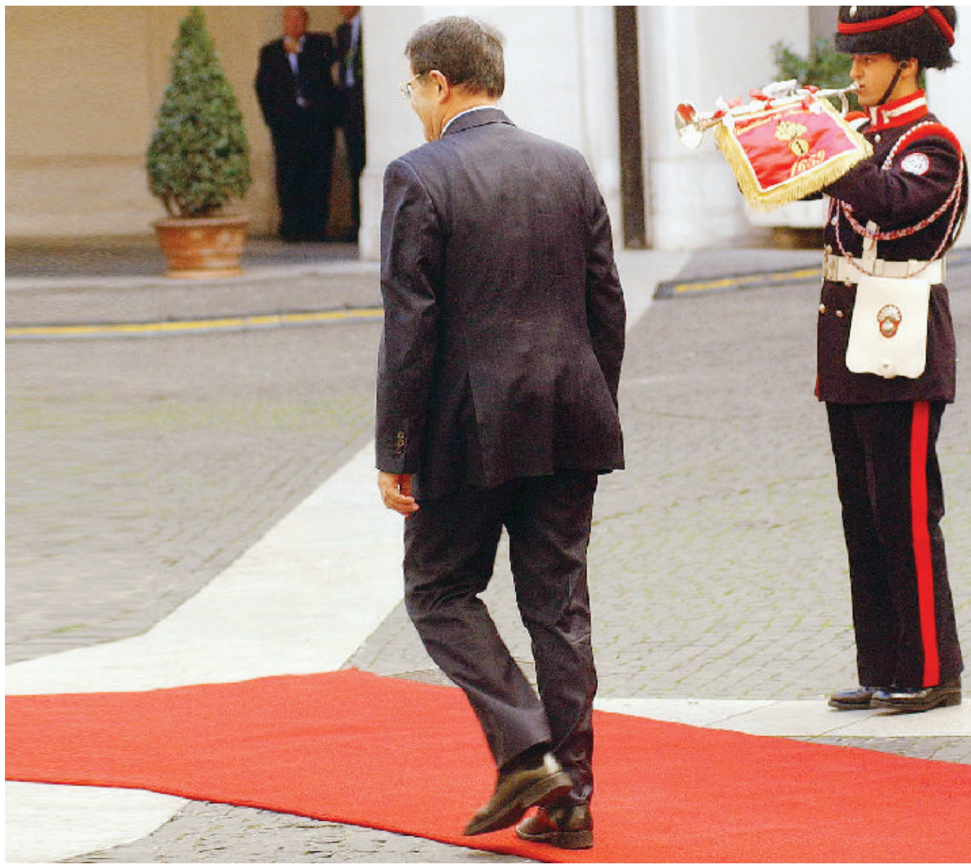
Il presidente del Consiglio Romano Prodi si è recato ieri al Quirinale per rassegnare le dimissioni