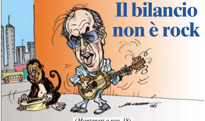
(Montanari a pag. 18)