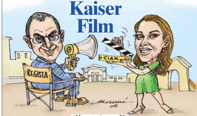
(Montanari a pag. 22)